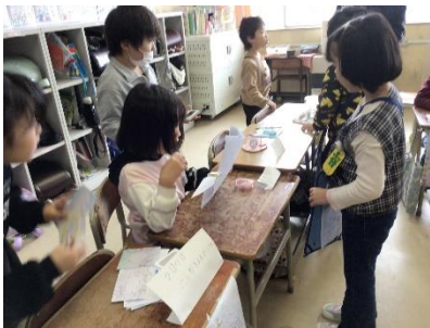
↑ 2年国語科「おもちゃまつり」。1年生と富谷校の皆さんを招待して楽しんでもらいました。

早いもので、今年度の残りの授業日数は3月1日から数えると、1年生から5年生は15日、6年生は卒業式まで11日となりました。子供たちには、今の学年で学んだことを振り返り、4月と比べた自分の成長を見付ける機会を各学年で持っていきます。同時に、「もっとこんな自分を目指したい」という目標も持ちながら、年度末を迎えられるように指導していきたく思います。