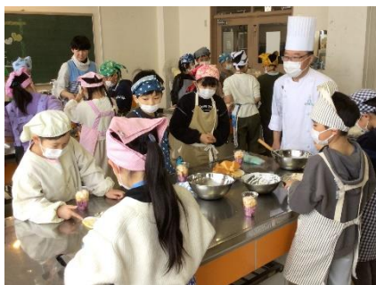
← 3年総合。富谷市産業観光課の方にご協力をいただき、「白いオルゴール」さんの指導のもとスイーツ教室開催。

今年最後の読み聞かせ。→ サポーターの皆さんのおかげでたくさんの本に触れる機会をいただきました。