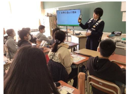
↑ 6年総合「職業調べ」として警察官、消防士、JR東日本の方々に「仕事」について教えていただきました。