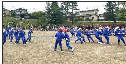
5・6年生 THE 綱をヒッパレ