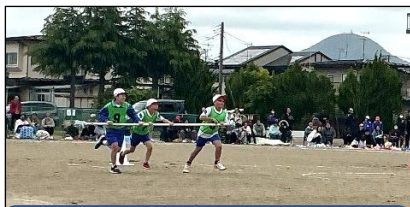
4年生 ぐるぐるタイフーン