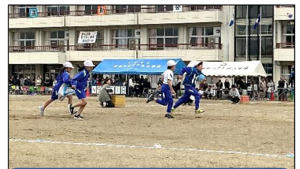
3年生 みんなで運べ元気玉！ ～フライシートリレー～