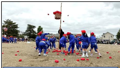
1年生 ダンシング玉入れ

さて、まもなく梅雨の時期を迎えます。これからは、スポーツテストが始まりますが、まだまだ寒暖の差が大きく、体調を崩しやすい時期でもあります。今後も学校では健康管理に十分留意しながら、学習や運動に取り組ませてまいります。ご家庭におかれましても、お子さんの健康管理により一層ご留意くださいますよう、よろしく願いいたします。