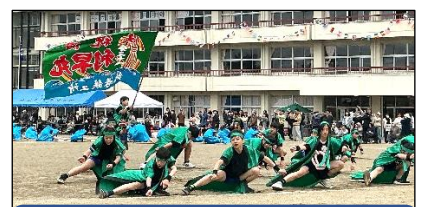
5・6年生 ソーラン乱舞