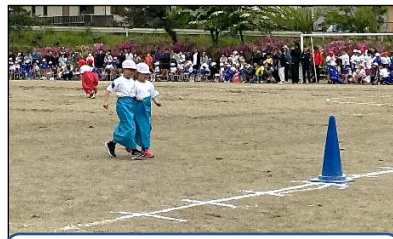
2年生 力を合わせて！ デカパンリレー